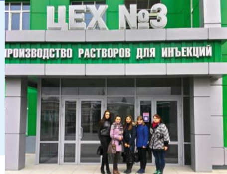
ЦЕХ №3 ПРОИЗВОДСТВО РАСТВОРОВ ДЛЯ ИНЪЕКЦИЙ

Будущие провизоры ознакомились с принципами функционирования серийных линий изготовления ампулированных лекарственных форм, таблеток и суппозиториях, а также установок получения воды для инъекций.