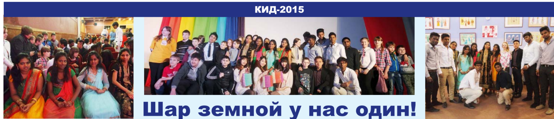
Н. В. ГОНЧАРЕНКО.

Студенты из Индии, Малайзии, Африки и арабских стран стали активными участниками