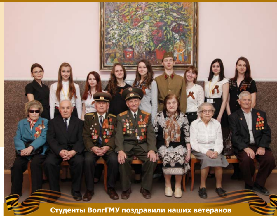
Студенты ВолгГМУ поздравили наших ветеранов

В 1954 году окончил Ленинградский институт физической культуры имени П. Ф. Лесгафта по специальности «Физическая культура и спорт».