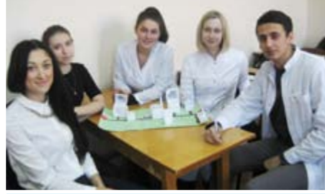
Победители культурологического квеста – студенты 2 курса педиатрического факультета 5 группы и 2 курса фармацевтического факультета 202 группы со своими проектами.

Культурология – наука о культуре, осваивать которую можно самыми разными средствами. Студентам, конечно, больше нравятся не занятия в аудитории, а что-нибудь активное и креативное.