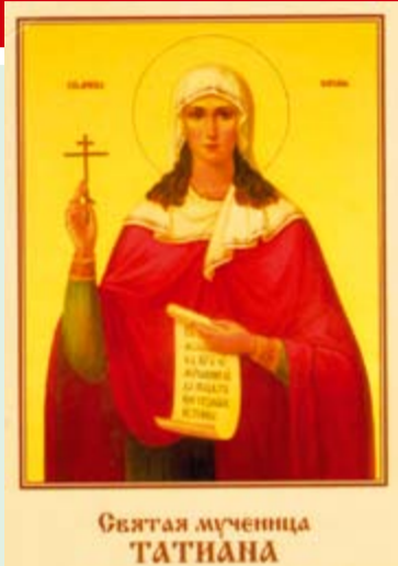
Святая мученица ТАТИАНА