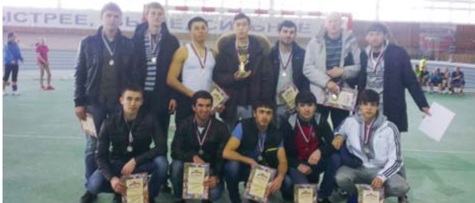
Второе место среди всех вузов Волгограда