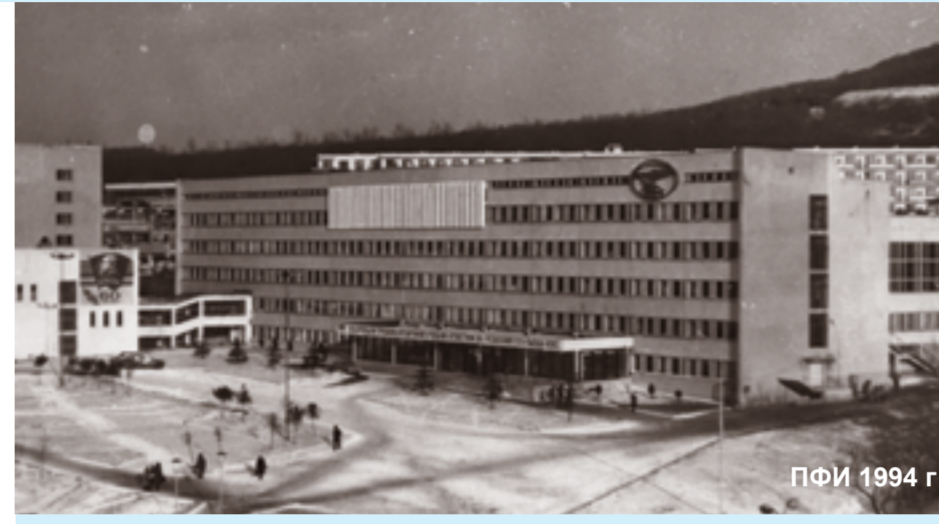
ПФИ 1994 г