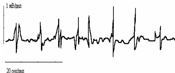
Рис. 1. Электроуретерограмма больного основной группы в ранний послеоперационный период

У больных основной группы в области артериального мочевого пузыря амплитуда медленных волн колебалась в диапазоне от 90 до 180 мкВ, в среднем составив 117,2±1,6 мкВ. Средняя частота следования медленных электромиографических комплексов соответствовала 5,6±0,03 в мин при диапазоне колебаний показателя 4–6,5 в мин. По сравнению с диапазонами нормальных значений медленных волн в тонкой кишке (в норме амплитуда медленных волн –