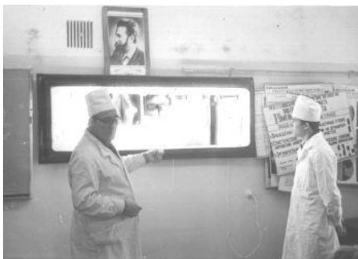
Демонстрация рентгеновских снимков на занятии