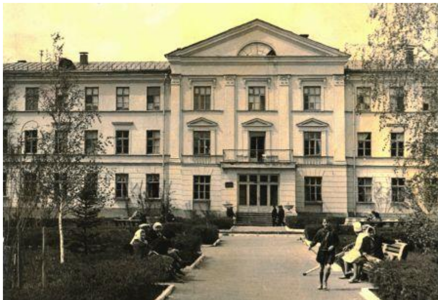
Здание, в котором была создана и размещена кафедра рентгенологии и медицинской радиологии Волгоградского Государственного Медицинского Института