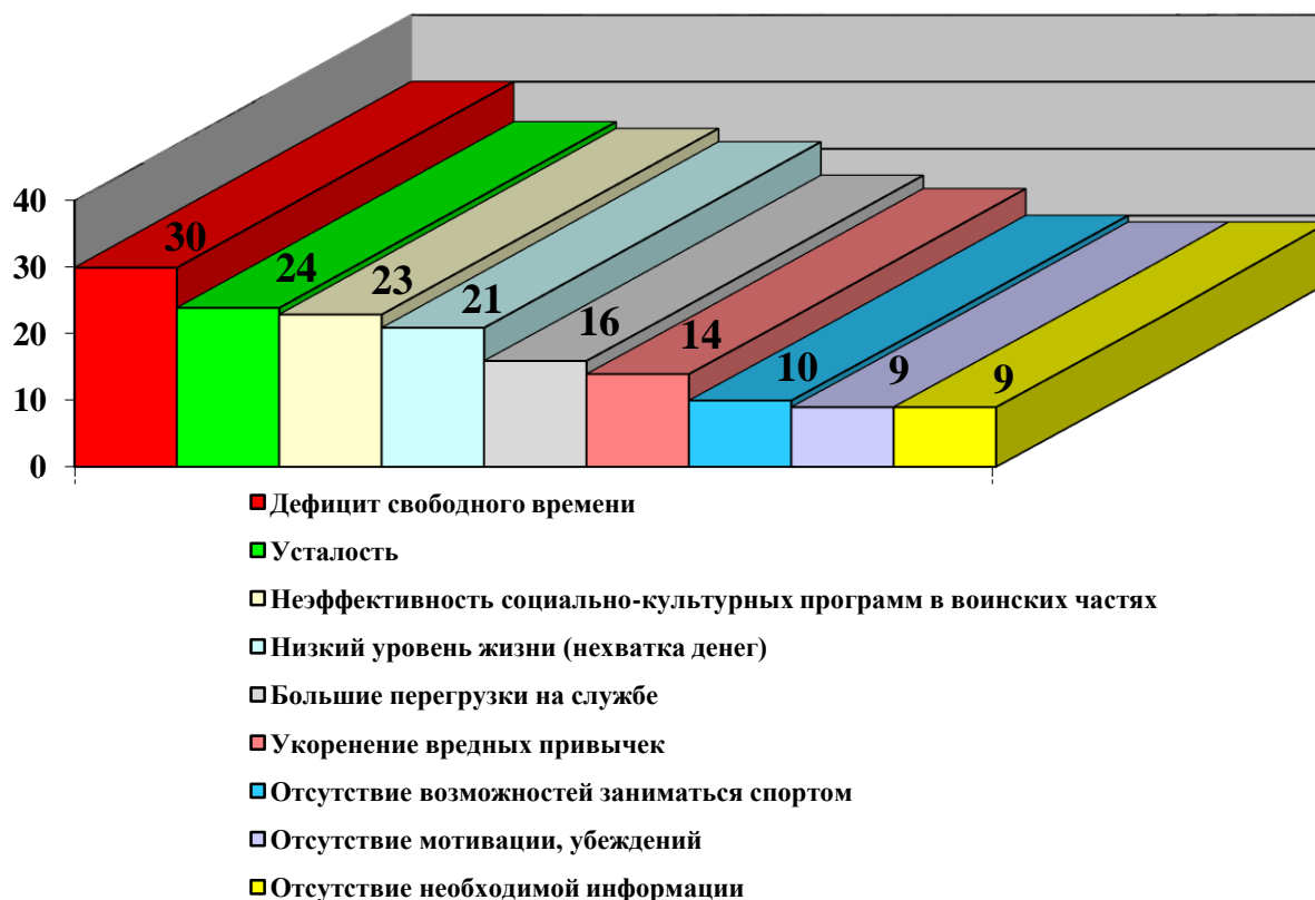
Рис. 2. Распределение ответов на вопрос: «Что является основным фактором торможения развития культуры здорового образа жизни военнослужащих?» (в % к опрошенным, n = 395).

культуры здорового образа жизни военнослужащих: укоренение вредных привычек (мнение 14% респондентов).