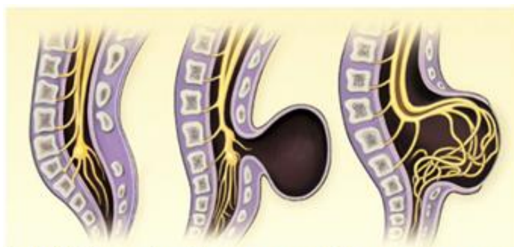
Spina bifida occulta Менингоцеле Миеломенингоцеле

Не сомкнувшийся в трубку спинной мозг лежит обнаженным; он представляет собой красноватую бархатистую плоскую массу, состоящую из большого количества расширенных сосудов и элементов мозговой ткани. При полном рахисхизисе описанная картина наблюдается на протяжении всего позвоночника, частичный рахисхизис обычно локализуется в поясничном отделе позвоночника. На месте дефекта дуг позвонков располагается не закрывшаяся в трубку зародышевая нервная пластинка — сосудисто-мозговая область ( area medullovasculosa ), которая лежит на мягкой оболочке спинного мозга. Участок последней от ее края до края кожи, покрытый тонким слоем эпидермиса, был назван эпителио-серозной зоной ( zona epitheliose-rosa ). Кнаружи от этой зоны располагается кожа — кожная зона ( zona dermatica ). Если в субарахноидальном (подпаутинном) пространстве скапливается цереброспинальная жидкость, может возникнуть спинномозговая грыжа — миеломенингоцеле. Рахисхизис может сочетаться с расщеплением тел позвонков. При рахисхизисе, особенно полном, часто встречаются пороки развития головного мозга и других органов. Спинномозговые грыжи представляют собой грыжевидные выпячивания мозговых оболочек, нервных корешков или спинного мозга через щель позвоночника. В зависимости от состава грыжевого выпячивания и расположения цереброспинальной жидкости (между оболочками спинного мозга или в центральном канале) различают несколько форм спинномозговых грыж: менингоцеле, менингорацидулоцеле, миеломенингоцеле, миелоцистоцеле.