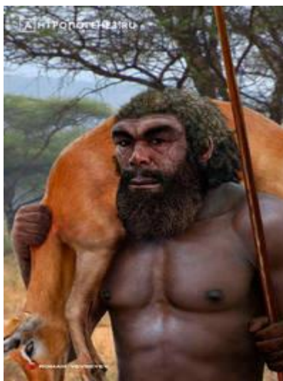
Реконструкция человека из Брокен Хилл. Автор – Роман Евсеев, https://vk.com/other_worlds_studio

«Африка — прародина человека». Сейчас это утверждение звучит почти как аксиома, но так было далеко не всегда. Только комплекс самых современных исследований, включая генетические анализы, убедил большинство учёных в том, что теория об африканской прародине самая правдоподобная. И хотя о том, что человек возник в Африке, писал ещё сам Дарвин, чёрный континент долгое время оставался на периферии интересов «охотников за прародиной». Об одной из ключевых находок нашей африканской родословной, о том, откуда взялся и куда канул «тропический неандерталец», и о таинственном «пулевом отверстии в черепе каменного века».