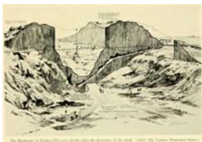
Схема рудника Брокен-Хилл и пещеры, в которой был найден череп.

И если бы родезийский человек уже много тысяч лет не спал вечным сном, то утром 17 ноября 1921 года он проснулся бы знаменитым. В тот день журнал Nature открыл длинную череду статей о новоприобретённом предке человека. Пока уважаемый британский журнал публикует только короткую статью — полторы страницы — написанную известным палеонтологом Артуром Смитом Вудвордом, который курировал отдел геологии в Британском музее. Статья называлась «Новый пещерный человек из Родезии, Южная Африка».